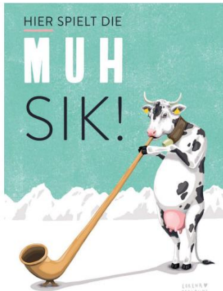
Die einheimische Künstlerin Lenora Paterlini gestaltet für den Verein Kultur am Pass verschiedene Postkarten-Motive.